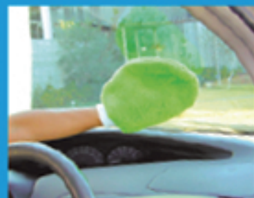
ガラスの汚れ取り