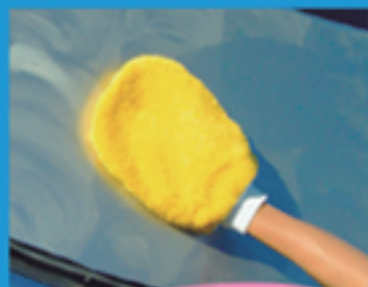
ワックスふき取り ツヤ出し