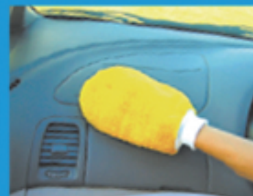
車内の 汚れ・ホコリ取り