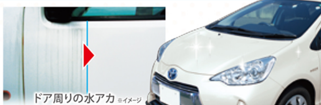
ドア周りの水アカ ※イメージ

クリーニング効果でボディをリフレッシュしながらガラス系コーティング成分により、滑る様なツルツルボディに仕上げます。強固なコーティング膜ができ、撥水効果で雨・汚れをしっかり弾き飛ばします。