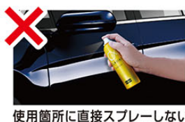
使用箇所に直接スプレーしない