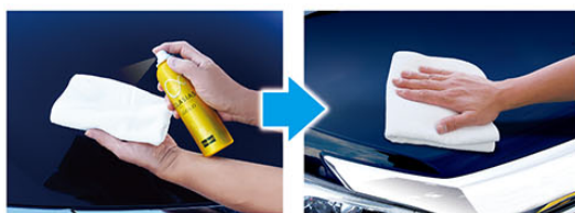
クロスにスプレーする

2枚のクロスを、「塗り込み用クロス」・「拭き取り用クロス」に分けてお使い下さい。